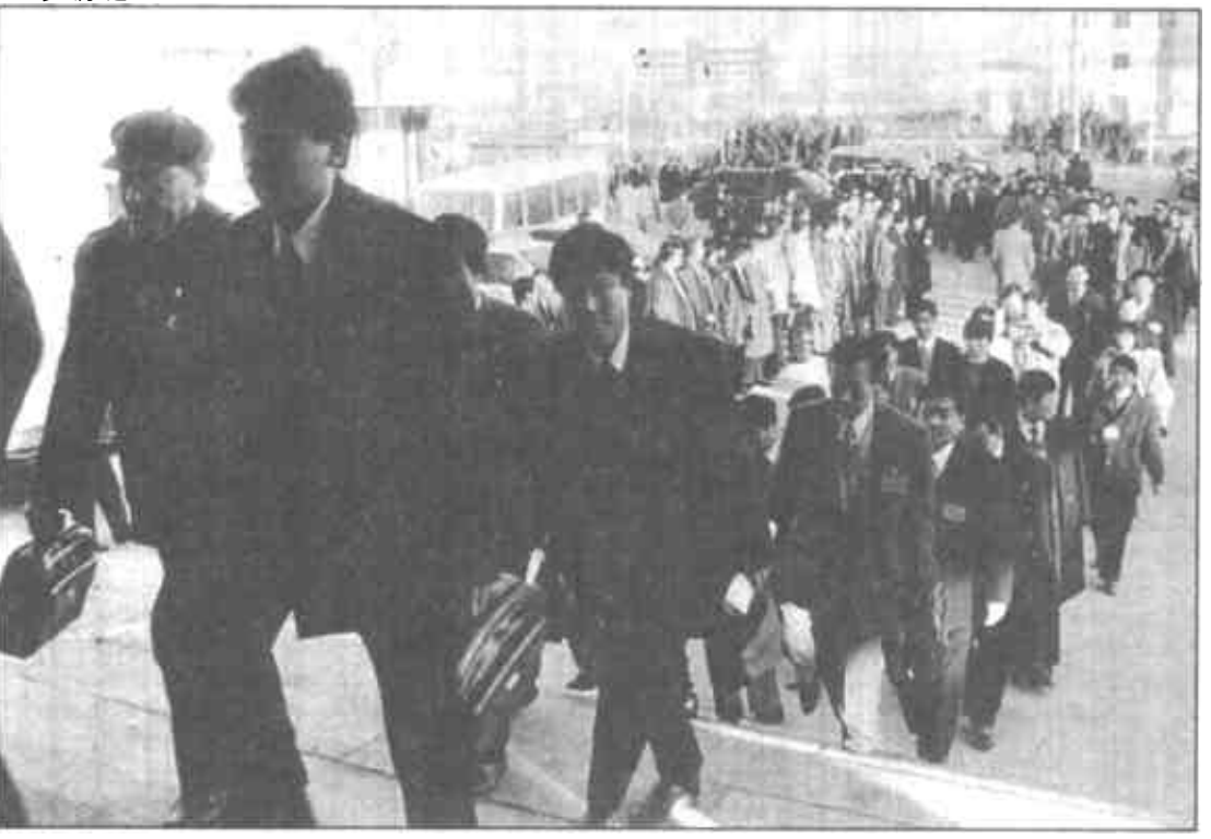
市人大代表在分组审议政府工作报告时认为报告实事求是目标鼓舞人心

入负出我 会着市各 入全市四 会市人条 会市人战 会市人线 会市人大 会市大的 会市代重 会市托代 会市步新 会市选自 市三届人大五次 会议以来的代表 建议、批评和 意见已全部办复 度重视。市人大常委会把做好代表建议办理工作作为常委会工作重点之一，放在了重要位置；市政府召开常务会议或市长办公会议，听取代表建议办理工作的情况汇报，研究解决一些重要问题，并要求各级各部门的一把手亲自抓，分管领导靠上抓；市中级人民法院、胜利石油管理局都成立了代表建议办理工作领导小组，狠抓办理质量，严格办理时效，办理水平大幅度提高。 为有针对性地解决问题，取得代表的理解和支持，各承办单位还转变作风，注重实效，切实以对代表负责的态度，深入实际，调查研究，提高了代表满意度。 (记者 李建凤)