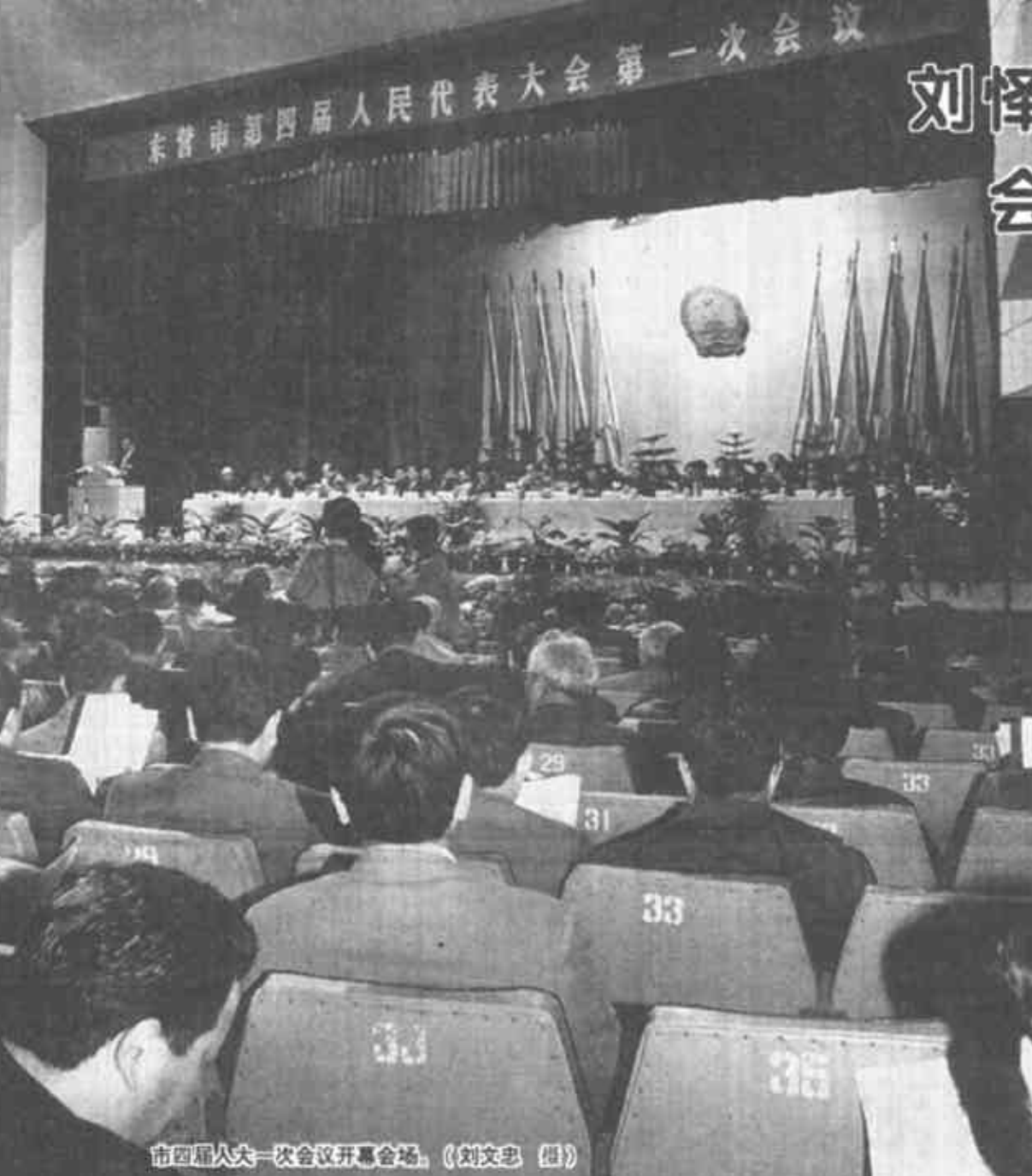
市四届人大一次会议开幕会场。